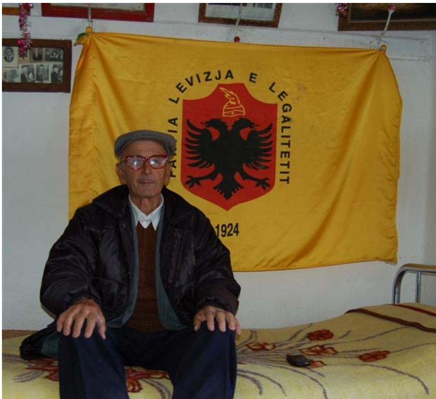
Far Lika med kongebewægelsens flag

Da dén forklaring var blevet oversat, syntes jeg at kunne fornemme en tilfreds mumlen. »Akkurat sådan skal det være«, tror jeg det betød. »Folk der kører tåbeligt skal straffes og ikke slippe - ligegyldig hvor højt på strå de er - og hvor mange venner der er parat til at hjælpe dem«.